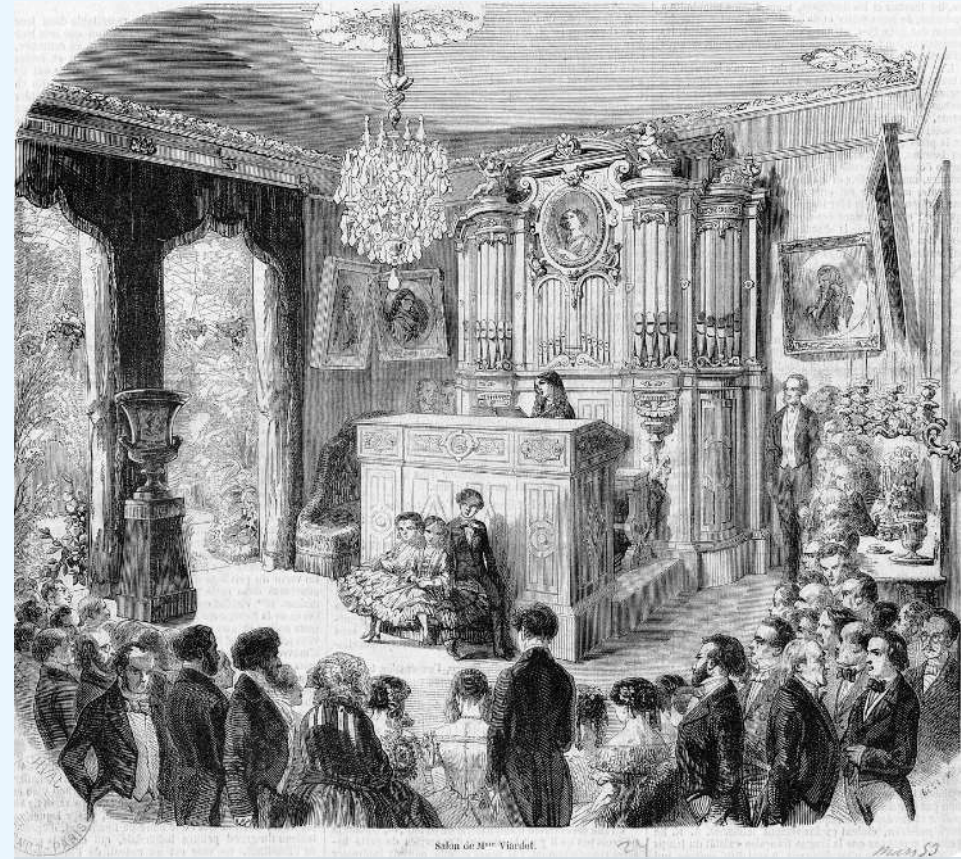
Salón de Mme Viardot. 1855 de Juan A. Boppe