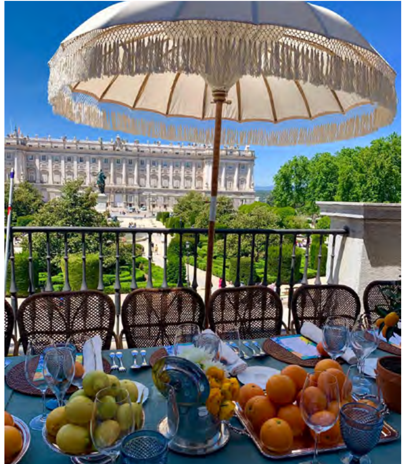
Evento Efímero 2019