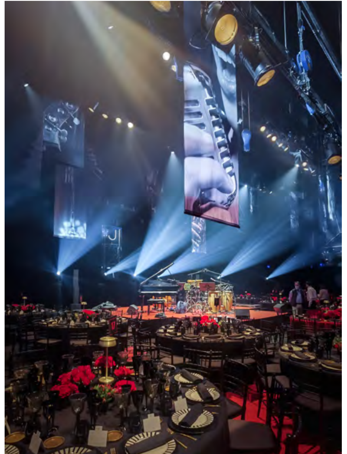
Gala Anual del Teatro Real 2021