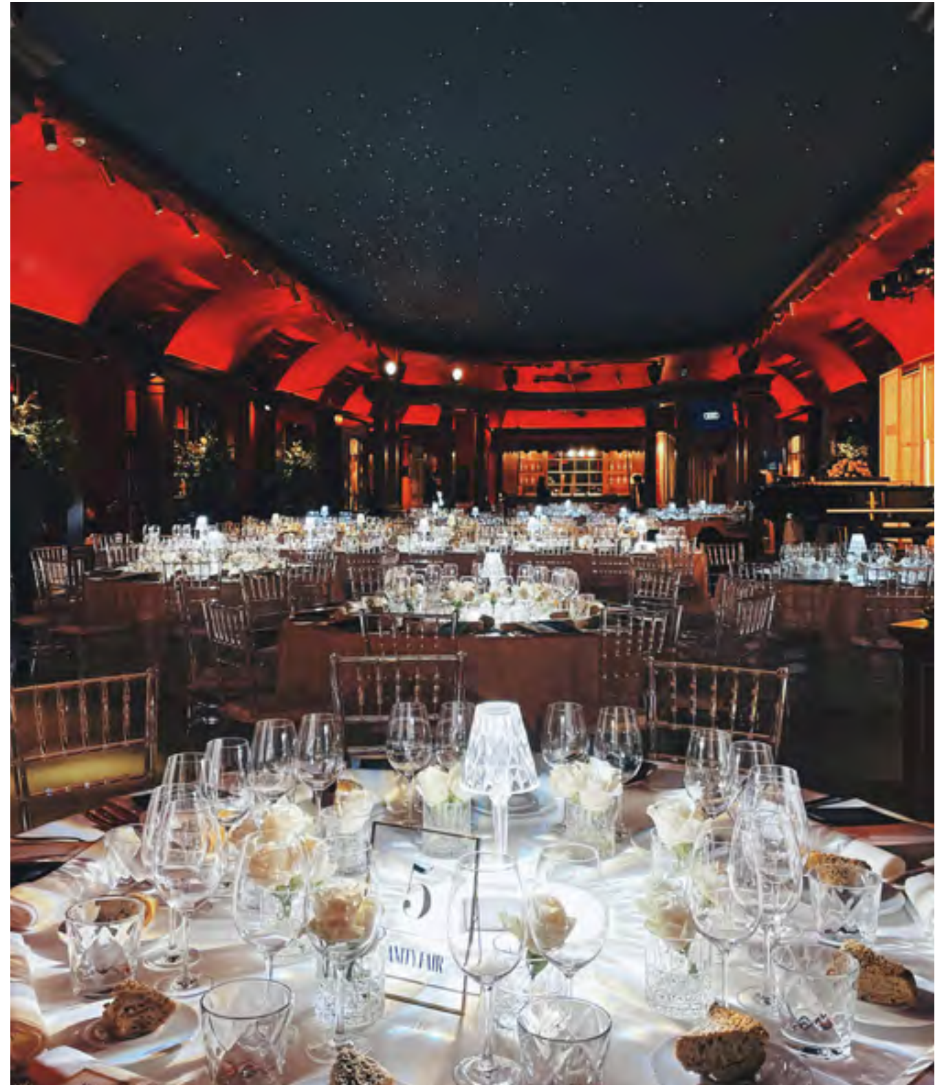
Personaje del año Vanity Fair 2021