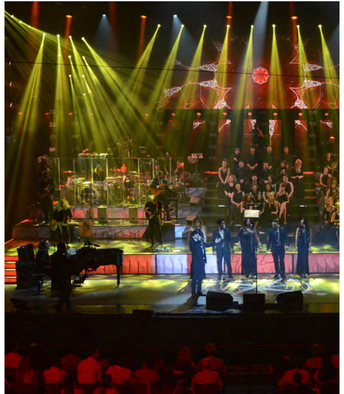
Universal Music Festival 2015