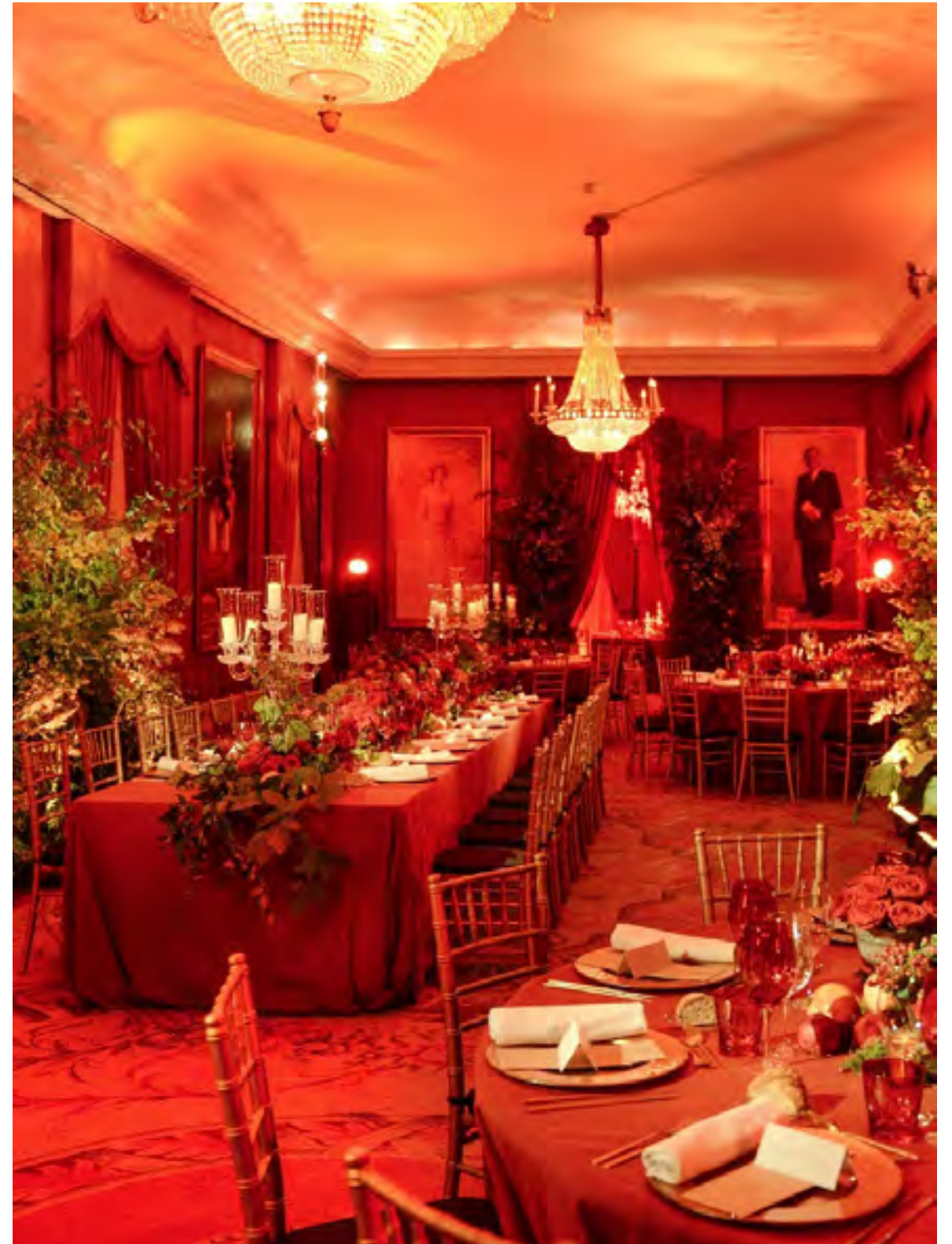
Gala Anual del Teatro Real 2018