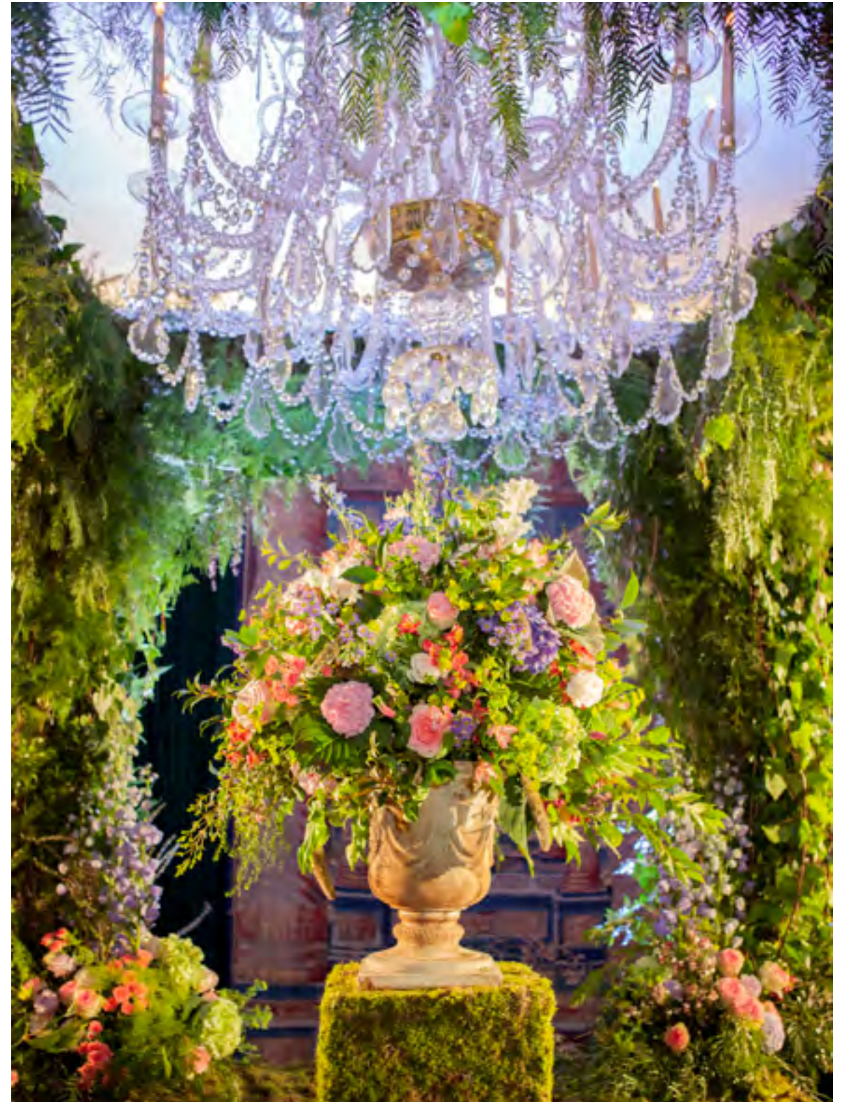
Premios T de Telva 2019