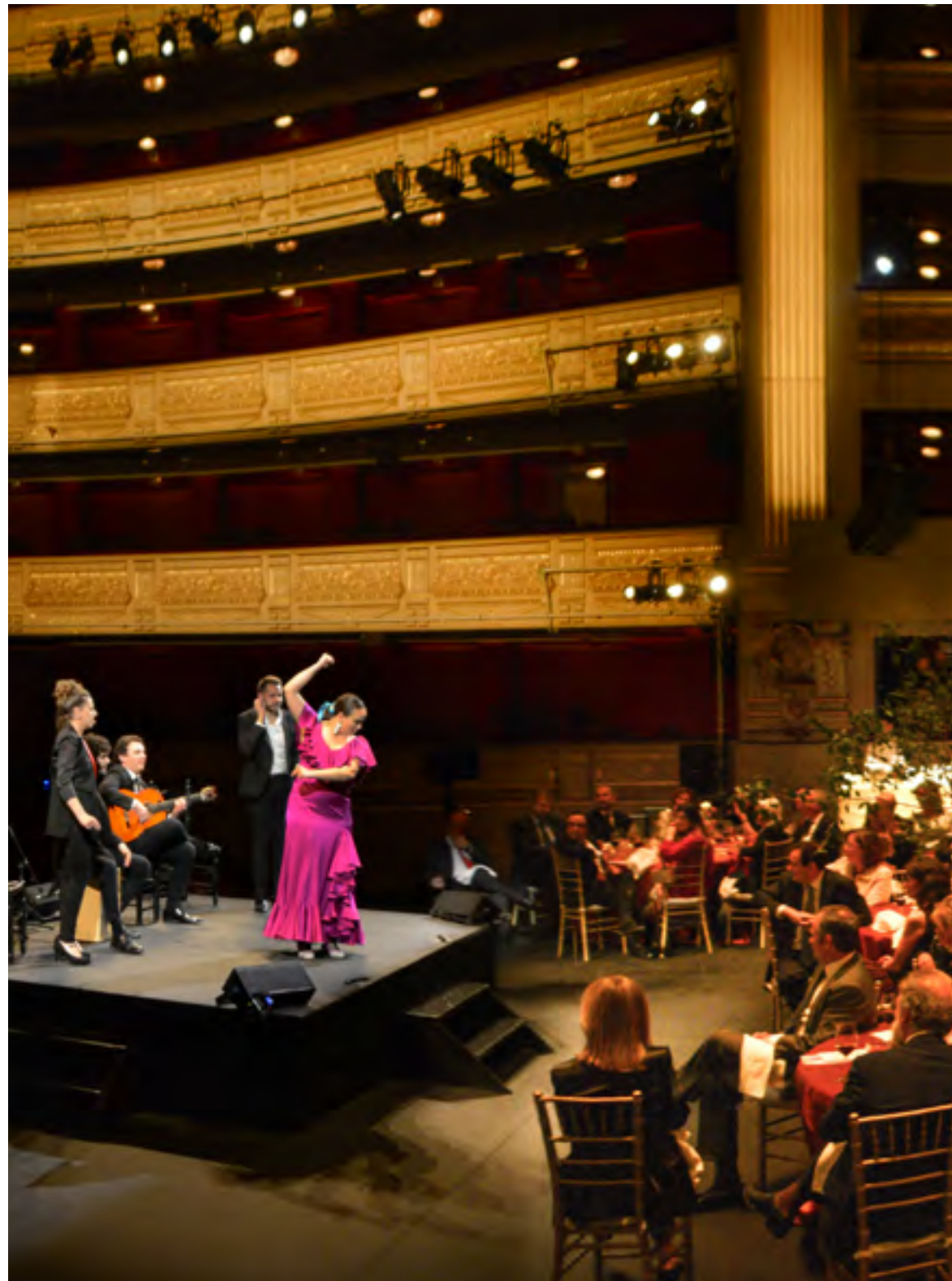
Cena de Patrocinadores Bicentenario Teatro Real