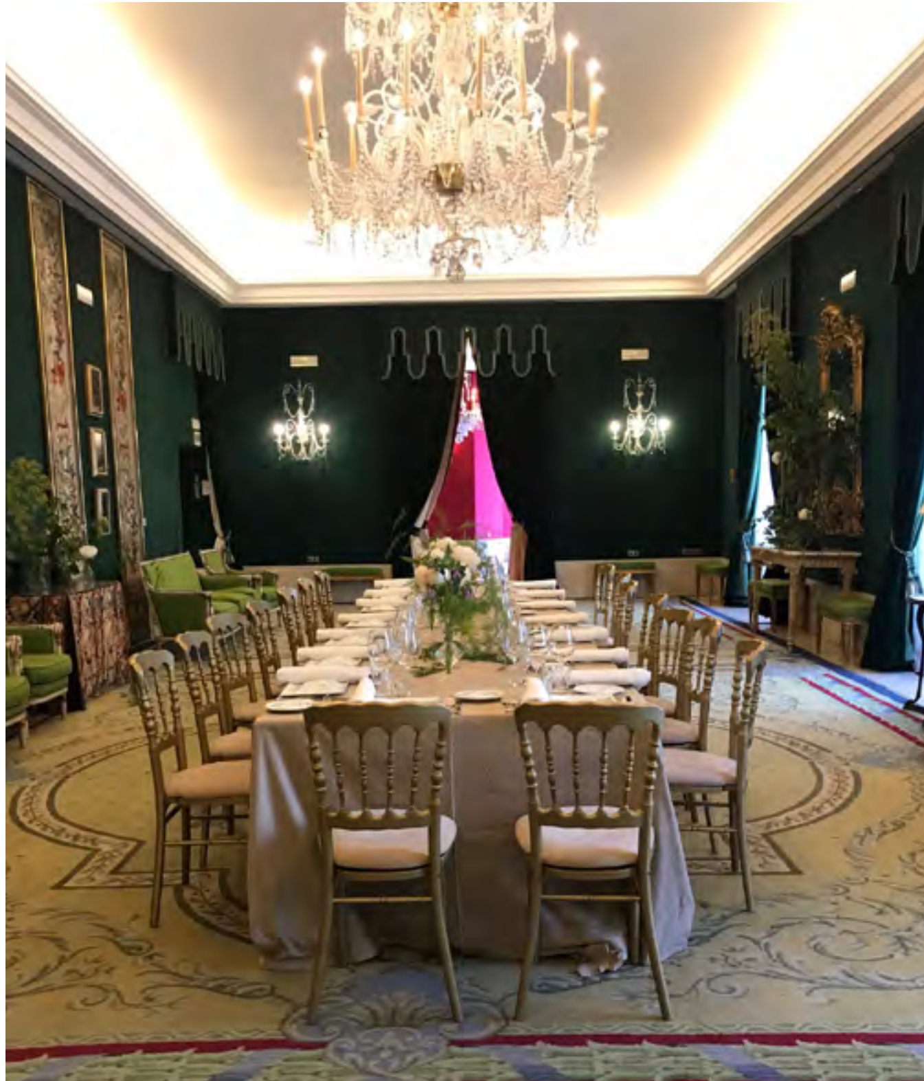
Almuerzo institucional Teatro Real 2022