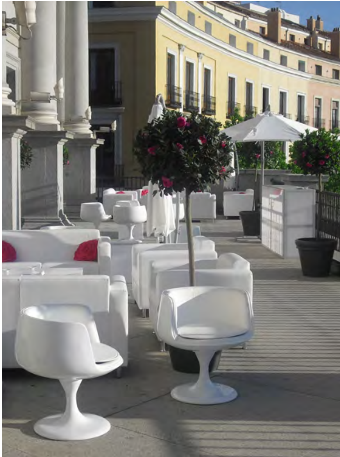
Evento Piaget 2017