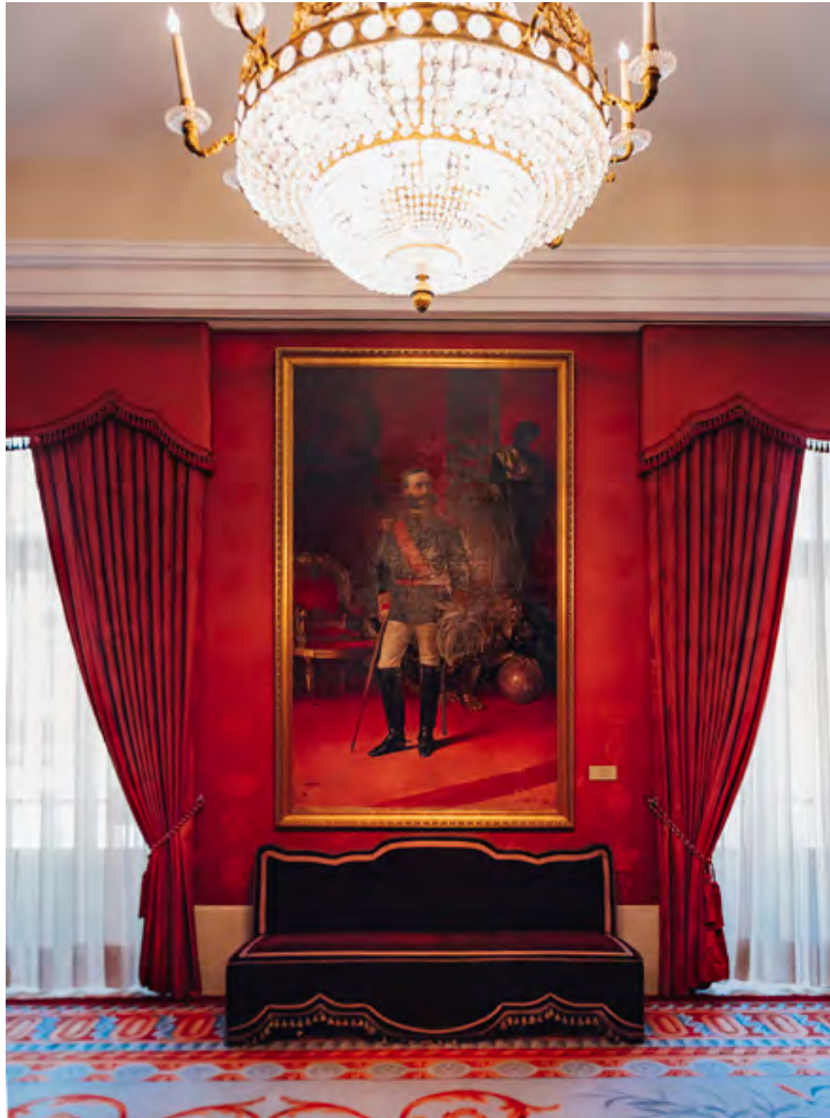
SALÓN FELIPE V