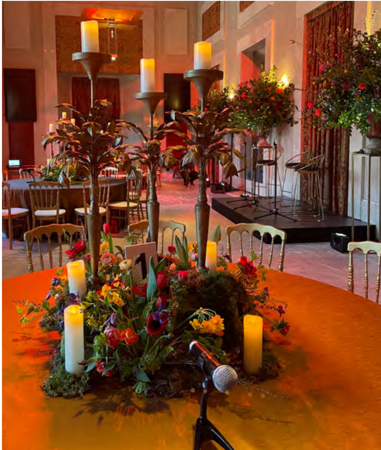
Evento Banco Santander 2019