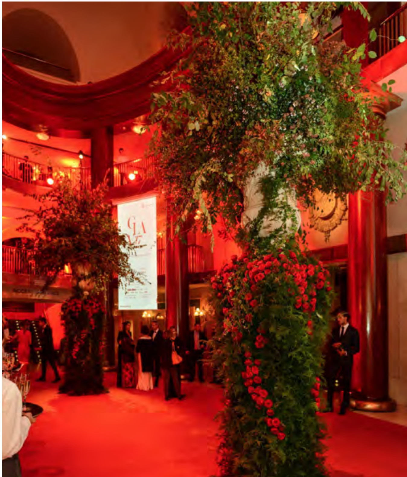
Gala Anual del Teatro Real 2017