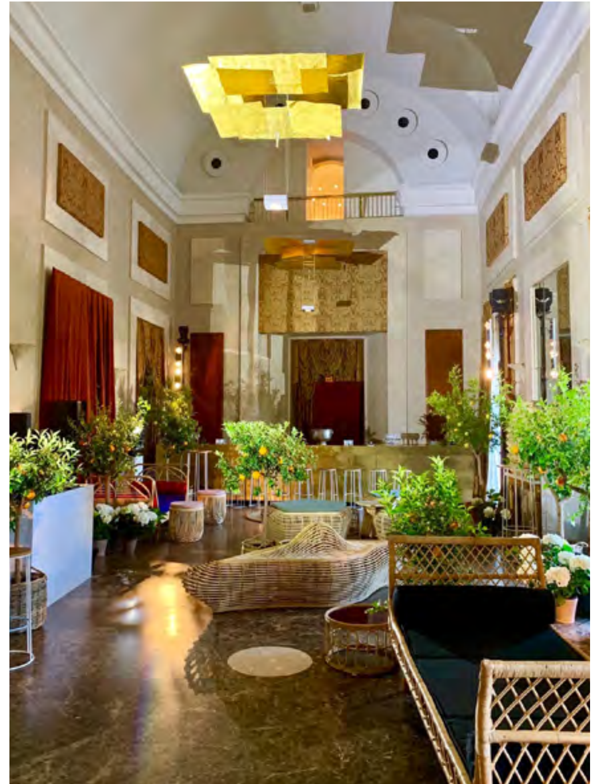
Evento Efímero 2019