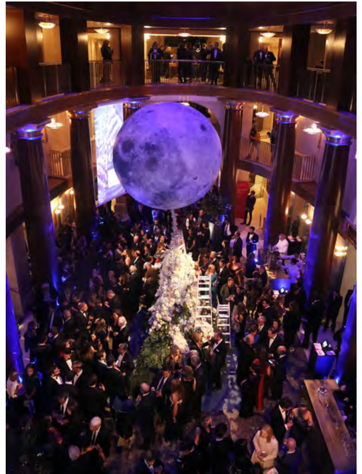
Gala Anual del Teatro Real 2019