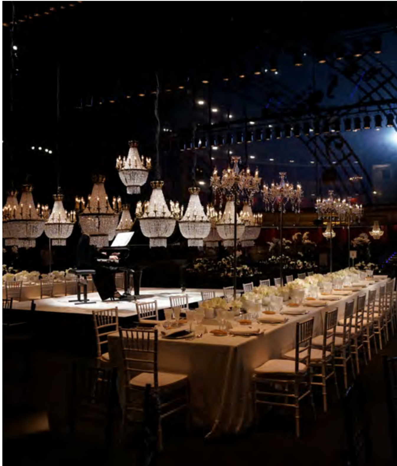
Gala Anual del Teatro Real 2019